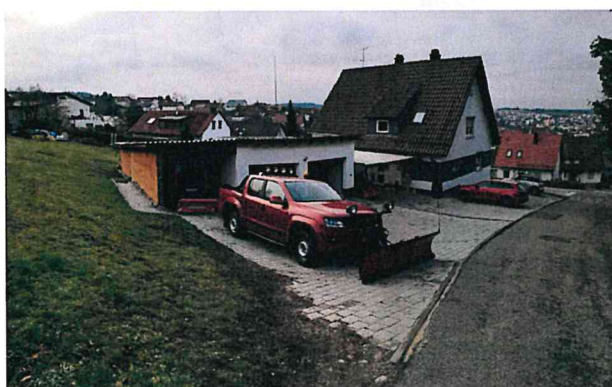
Blick von der Bruder-Konrad-Straße auf den nordwestlichen Teil des Plangebietes

Der südliche und östliche Teil des Plangebietes besteht aus häufig gemähten Wiesenflächen (Intensivrasen), auf denen einzelne hochstämmige Obstbäume neu gepflanzt wurden. Vom Buchenweg führt eine geschotherte Zufahrt in diesen Bereich, der teilweise auch als Lagerfläche genutzt wird.