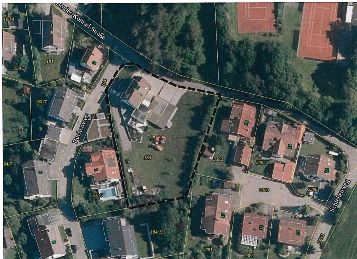
Luftbildausschnitt mit Katastergrenzen

Der nordwestliche Teil wird von einem Wohnhaus mit angrenzenden Garagen und den zugehörigen Verkehrsflächen an der Bruder-Konrad-Straße eingenommen.