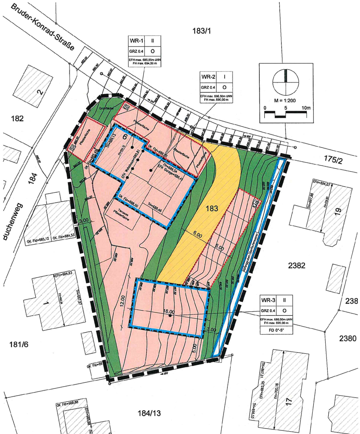
Ausschnitt aus dem zeichnerischen Teil des Bebauungsplanes (Vorentwurf vom 20.12.2021, kommunalPLAN GmbH)

Ausgewiesen wird ein Reines Wohngebiet nach § 3 BauNVO. Zulässig sind ausschließlich Wohngebäude, für die entsprechende Baufenster in den zeichnerischen Teil des Bebauungsplanes werden.