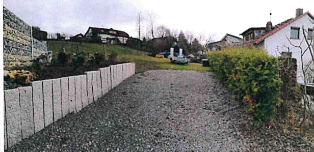
Blick von der Zufahrt am Buchenweg auf den südlichen Teil des Plangebietes

Am östlichen Rand zur benachbarten Bestandsbebauung stockt ein kleiner Bestand aus heimischen und nicht heimischen Ziersträuchern